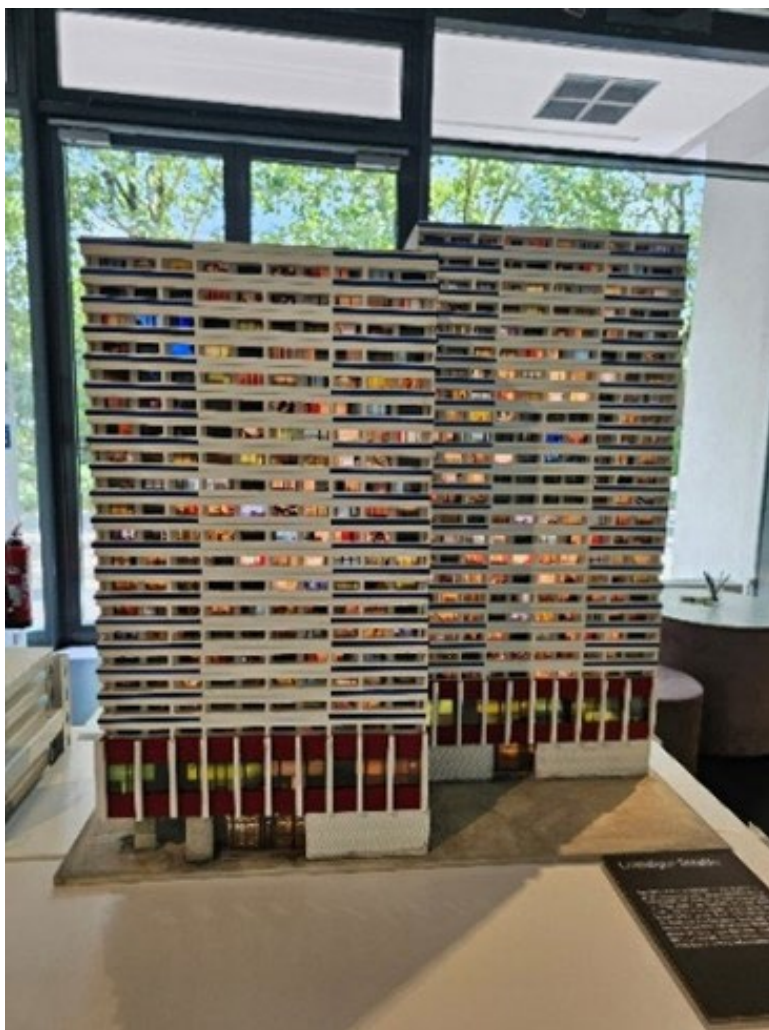
Abb. 3: Hochhaus in der Leipziger Straße

Fast eine ganze Stirnwand des Ausstellungsraumes ist mit gelben Zetteln der ersten Ausstellungsbesucher mit ihren Wünschen für ein sicheres, gesundes Wohnen und harmonisches Zusammenleben ausgefüllt (Abb. 4). Hier heißt es z.B. auf einer Notiz an der Pinnwand: „Mehr Schutz und finanzielle Unterstützung von sozialen Projekten, Kultur, kulturelle Orte, Events für alle Altersgruppen. Ausbau und Verbesserung des ÖPNV in Berlin – weniger Individualverkehr“.