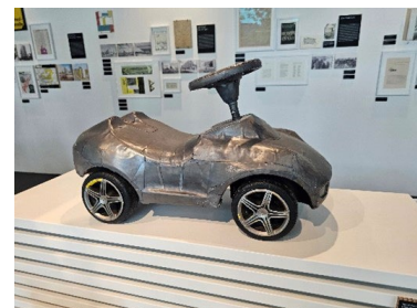
Abb. 7: Bleibobycar

Der Künstler und Architekt Martin Kaltwasser fokussiert sich auf das Thema Umweltverschmutzung und Verkehr. Mit „Platz da für meinen SUV“ weist er auf die Absurdität riesiger Geländewagen in der Stadt hin. Obwohl viele Anwohner für Radwege, die Umnutzung von Parkflächen und verkehrsberuhigte Zonen kämpfen, nimmt in Berlin die Zahl der Stadtgeländewagen (SUV) zu, die Realisierung einer Straßenbahnlinie auf der Leipziger Straße aber wird aufgeschoben. Das Bleibobycar, groß wie ein Kinderspielzeug, verkörpert durch seine schwere Ummantelung Aggressivität, Spieltrieb und Umweltbelastung (Abb. 7).