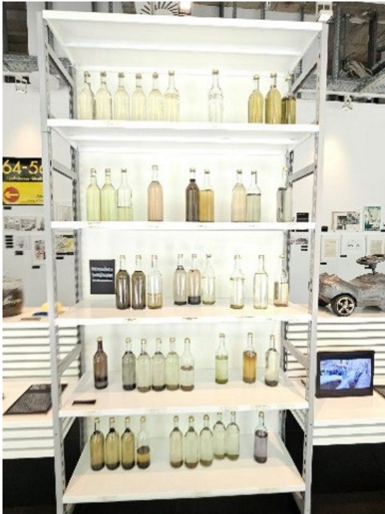
Abb. 5: Pfützenarchiv

des Bodens, dessen Versiegelung und den Wasserkreislauf verrät (Abb. 5).