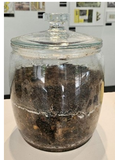
Abb. 9: Boden im Glas

Drei Hüllen umgeben den menschlichen Körper: die Haut, die Wohnung und die Umwelt. Alle müssen funktionieren und physiologisch, d. h. menschenverträglich sein, damit wir auch langfristig überleben!