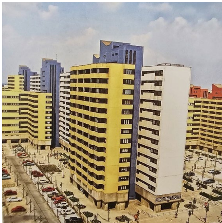
Abb. 2: Märkisches Viertel Berlin 1979

Trotz aller Kritik hinsichtlich der Monotonie, fehlender Infrastrukturen und der ungenügenden sozialen Durchmischung, ziehen viele Menschen aber gern aus den überfüllten Altbauten in diesen neuen, mit modernen Sanitär- und Heizungskomfort ausgestatteten Hauskomplexe.