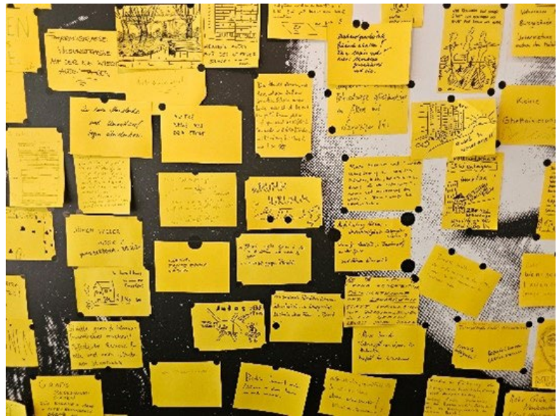
Abb. 4: Wünsche für ein gesundes und sicheres Wohnen

Nachdem mit der Wiedervereinigung der quirlige Verkehr jeden freien Raum dieses Gebietes erobert hat, treten immer mehr Bürger für eine Verkehrsberuhigung ein. Urbanität wird wieder zum ersehnten Ziel. Seit langen gibt es die Forderungen nicht nur der „Interessengemeinschaft Leipziger Straße“ für die 6500 Bewohner wieder eine lebenswerte, urbane Umgebung zu schaffen.