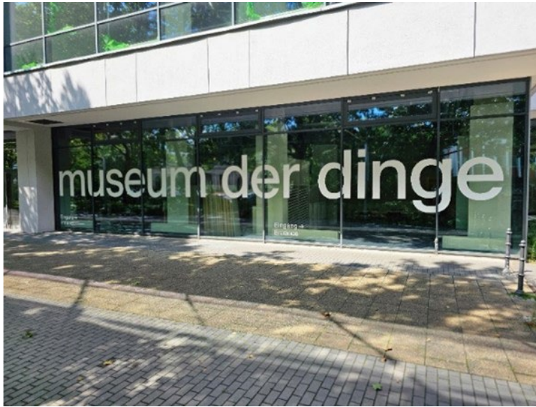
Abb. 1: Werkbundarchiv – Museum der Dinge

roten Faden der Präsentation erarbeitet hat, wird dann aber die Botschaft immer klarer.