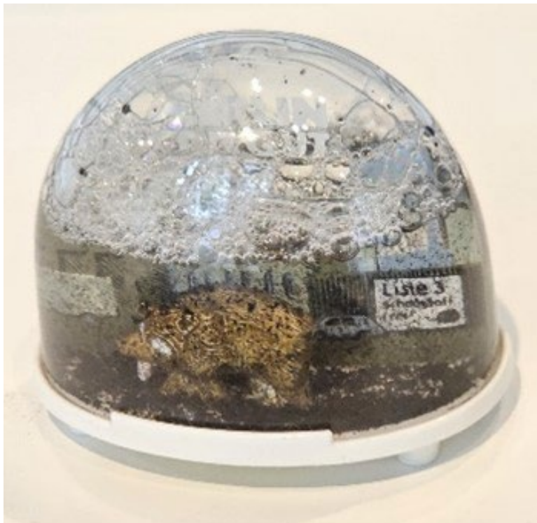
Abb. 8: „Schneekugel“ mit Smogteilchen

Mit einer ungewöhnlichen, mit Smogteilchen gefüllten „Schneekugel“ machte die „Alternative Liste für Demokratie und Umweltschutz“ (später „Bündnis 90/die Grünen Berlin“) schon während des Wahlkampfes für das Berliner Abgeordnetenhaus 1985 auf die schlechte Berliner Luftqualität durch Kohleheizungen und Industrieabgase aufmerksam (Abb. 8). Rußpartikel anstelle weißer Flocken schweben über einer imaginären Landschaft und stehen symbolisch für alle Arten von Luftverschmutzung.