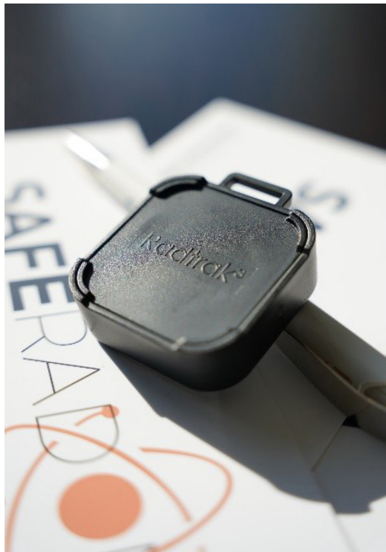
Abb. 1: Radtrak 3 , Aktives Messgerät für Kurz- und Langzeitmessungen

Die Radonkonzentration wird meist in Becquerel je Kubik-